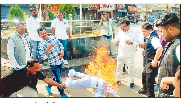
पुतला दहन करते कांग्रेसी।