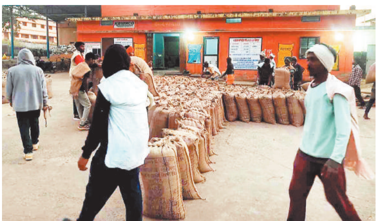
शौरपुर धान खरीदी केन्द्र।

धान खरीदी प्रारम्भ हुए 10 दिन से अधिक हो गया है लेकिन अभी तक किसानों का पंजीयन, कैरी फॉरवर्ड एवं ऑनलाइन गिरदावरी की त्रुटि के कारण रकबे में आई कमी का सुधार नहीं हो सका है। किसान अपनी उपज बेचने को लेकर परेशान हैं तथा तहसीलदारों को रकबा सुधारने का आवेदन दे रहे हैं। अधिकारी जट्टियों को जल्द सुधारने का आश्वासन दे रहे हैं लेकिन निर्धारित समय में सुधार नहीं होने के कारण कृषक परेशान हैं। सहकारी समितियों में अवैध धान की आवक रोकने इस बार शासन द्वारा ऑनलाइन गिरदावरी कराने के साथ ही कई नए नियमों को लागू किया है जिसके कारण किसानों को कई समस्याओं का सामना करना पड़ रहा है। धान खरीदी के पूर्व शासन द्वारा निजी संस्थाओं के माध्यम से ऑनलाइन गिरदावरी कराई गई थी जिसे एग्रोस्टेक नाम दिया गया है। किसानों का कहना है कि ऑनलाइन गिरदावरी की त्रुटि के कारण बड़ी संख्या में किसानों का रकबा कम हो गया है वहीं कई किसानों का रकबा शून्य हो गया है। शासन द्वारा जट्टियों के सुधार के लिए 25 नवम्बर तक की तिथि निर्धारित की गई थी। इधर रकबे में हुई कटौती को लेकर किसान काफी परेशान हैं तथा सुधार के लिए तहसील कार्यालय एवं प्रशासन किसानों को सहकारी समितियों में भेजा जा रहा है वहीं समिति प्रबंधक तहसील कार्यालय से सुधार करने का हवाला देकर किसानों को बैरंग लौटा रहे हैं। परेशान किसान तहसील कार्यालयों में रकबा सुधार का आवेदन देकर निर्धारित समय पर समस्याओं का निराकरण नहीं होने पर धरना प्रदर्शन एवं आंदोलन करने की चेतावनी दे रहे हैं। समस्याओं को देखते हुए शासन द्वारा पंजीयन एवं रकबा सुधार की तिथि बढ़ाकर 30 नवम्बर निर्धारित की गई है। नए निर्देशों के तहत सहकारी समितियों को भी जट्टियों को सुधारने का अधिकार दिया गया है।